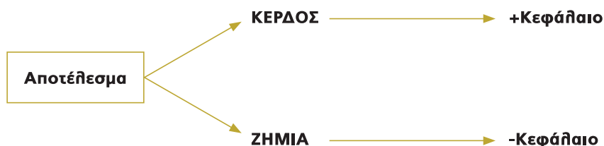
Μεταβολή του Κεφαλαίου στις ατομικές επιχειρήσεις

Αύξηση του Κεφαλαίου (+Κ.Π) κατά 500 Ευρώ, γιατί η επιχείρηση κέρδισε 500 Ευρώ από την πώληση των εμπορευμάτων (τα πώλησε 2.500 Ευρώ ενώ κόστιζαν 2.000 Ευρώ, δηλαδή 500 Ευρώ περισσότερο από την αξία τους).